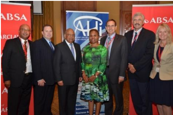
Entrepreneurship programmes with Trevor Manuel & Minister Lindiwe Zulu